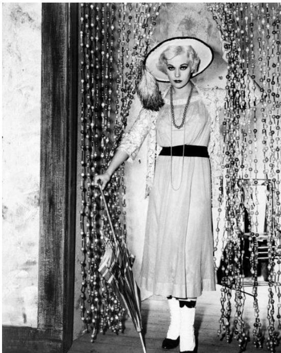
Fig. 5: Kim Novak nei panni di Jeanne Eagels nei panni di Sadie Thompson nel biopic di George Sidney del 1957

Se negli anni Settanta non era scontato che il grande pubblico si ricordasse ancora di Sadie Thompson, gli anni Cinquanta, oltre al film di Bernhardt e alla satira di Two's Company , vedono un'ulteriore personificazione di Sadie da parte di una delle maggiori dive del cinema americano, Kim Novak. Nel biopic di George Sidney dedicato alla vita di Jeanne Eagels ( Jeanne Eagels , in italiano Un solo grande amore ), del 1957 (cui partecipa, come sceneggiatore, John Fante), buona parte del film è dedicata al 1922, l'anno in cui Jeanne porta in scena Sadie (Figura 5). Ciò che, per mancanza di documenti registrati, non ci è concesso vedere, lo possiamo immaginare grazie alla ricostruzione, in un bianco e nero particolarmente evocativo, del dietro le quinte dello spettacolo di Broadway. Che Hollywood abbia deciso di dedicare un biopic a Jeanne Eagels, la “Rain Girl” per eccellenza, dimostra quanto il mercato culturale americano fosse consapevole del potere commerciale ed estetico del personaggio. Un potere e un valore che non è passato inosservato agli editori pulp , i quali hanno prodotto l'ennesima trasformazione del racconto, sebbene in questo caso sia solo una questione di packaging (Figura 6).