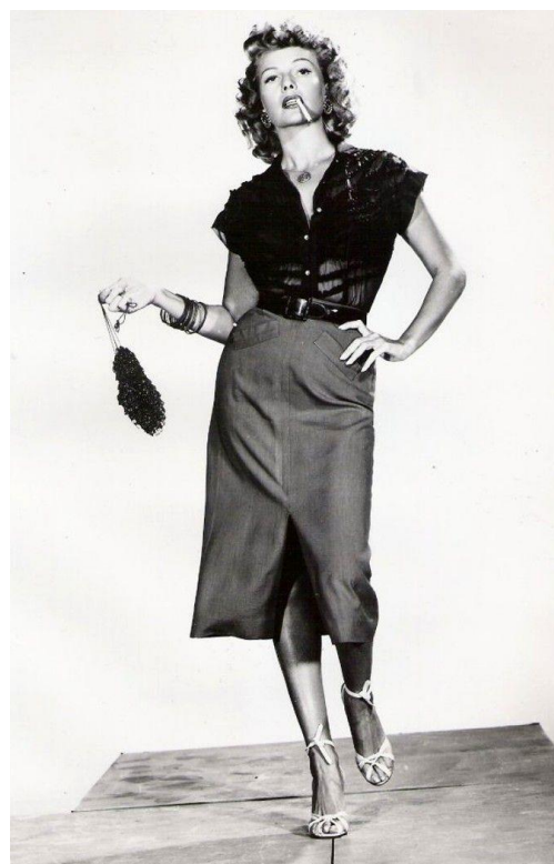
Fig. 9: Immagine pubblicitaria di Rita Hayworth per Miss Sadie Thompson ( Pioggia ), di Bernhardt Curtis, 1953, in cui è chiara la natura peripatetica di Sadie: come le epidemie, anche lei minaccia ogni luogo in cui arriva