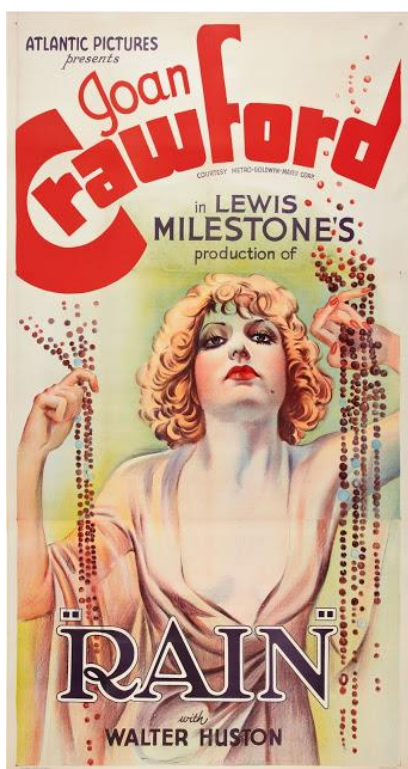
Fig. 8: Icona camp per eccellenza, Joan Crawford si impone allo sguardo del pubblico in tutta la sua sensualità. La ricorrente tenda di perline dimostra la teatralità insita nel personaggio, sipario attraverso il quale Sadie entra ed esce di scena

La resilienza del personaggio, le sue sfaccettature erotiche e sentimentali, la sua lotta contro un'oppressione che è religiosa, politica e coloniale, sessuale, maschilista e classista, ha fatto del racconto di Maugham una sorta di trattamento cinematografico, quella fase pre-sceneggiatura, cui registi e scrittori avrebbero attinto per anni a venire. Più che un percorso di adattamenti, e nemmeno propriamente di “adaptations as revision” come postulato da Thomas Leitch (2007), “Rain” è un testo che ha trasformato gli artisti successivi in quei textual poacher teorizzati da Henry Jenkins in relazione al fenomeno del fandom televisivo (1992). Alla stregua di tanti fans , registi, attrici, cabarettisti, disegnatori, musicisti, hanno pescato in modo più o meno legittimo (ma abbattendo al tempo stesso i confini della legittimità e dell'originalità testuale) dal racconto di Maugham applicandovi tutte le variazioni offerte dalla transmedialità.