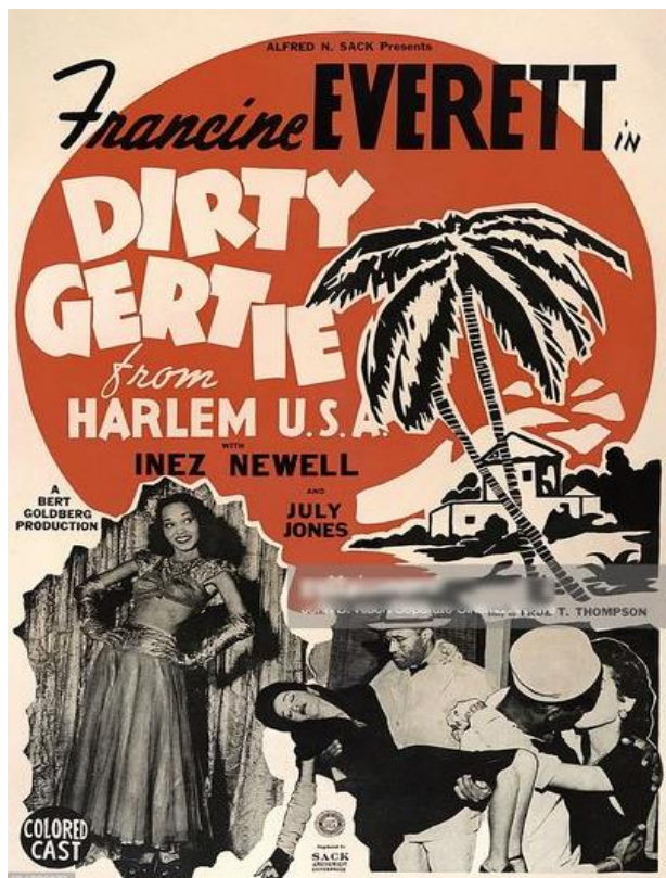
Fig. 3: La locandina del film di Spencer Williams, liberamente ispirato al dramma Rain .