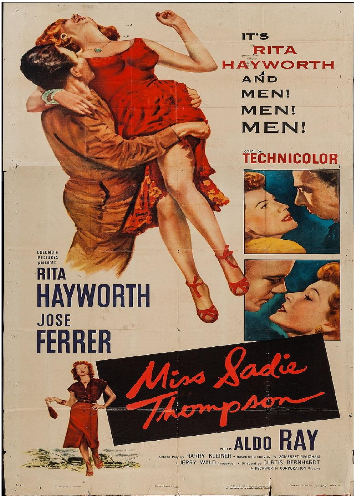
Fig. 1: Le pubblicità del film di Bernhardt del 1953 capitalizzano sulla fama di Rita Hayworth come mangiatrice di uomini, proiettando caratteristiche della diva sul personaggio di Sadie Thompson