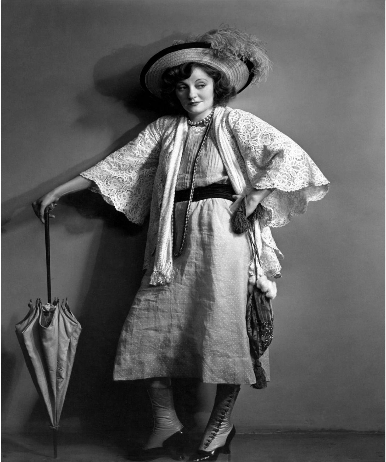
Fig. 10: Che Sadie fosse diventata presto un feticcio culturale è dimostrato anche dall'interesse degli addetti ai lavori. Nella foto Tallulah Bankhead, reduce da enormi successi nei teatri londinesi, tentò in ogni modo di assicurarsi il ruolo quando il dramma stava per essere allestito in Inghilterra dopo Broadway, nel 1925. Rifiutata dallo stesso Maugham, l'attrice inscenò un falso suicidio lasciando un biglietto in cui spiegava, "It ain't goin' to rain no moh." Nel 1935 riuscì ad avere la parte, ma lo spettacolo chiuse dopo 46 repliche. Il suo commento fu: "I caught up with Rev. Davidson ten years too late."