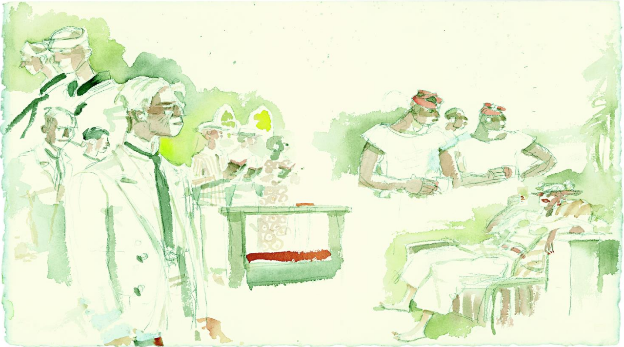
Fig. 2: “Ero indeciso se immaginare una Sadie non bella, ma provocante, grassoccia e vestita di bianco, l'originale di Somerset Maugham, o, meglio, sfruttare la più gradevole e più coinvolgente immagine cinematografica di Rita Hayworth, la Miss Sadie Thompson di Curtis Bernhardt, o addirittura tornare indietro alla Gloria Swanson di Raoul Walsh. Forse la cosa migliore era di disegnarne un'altra, quella che avrei voluto incontrare io, come il marinaio incurante dei sermoni di Davidson e della pioggia di Pago Pago.” (Pratt 2019, 96) Acquerello di Hugo Pratt © 1994, per gentile concessione di CONG sa, Svizzera

nei vari gruppi culturali. Oltre al fascino femminile – che sarebbe oscillato tra ironia ed esaltazione – personaggio e racconto sono imbevuti del fascino del viaggio, dell'avventura ai tropici, nei Mari del Sud. Ed è su questa ramificazione visiva che si innesta un transnazionale passaggio di medium, verso il fumetto, a opera di Hugo Pratt, il quale dedica al racconto di Maugham una delle storie di Avevo un appuntamento (Figura 2).