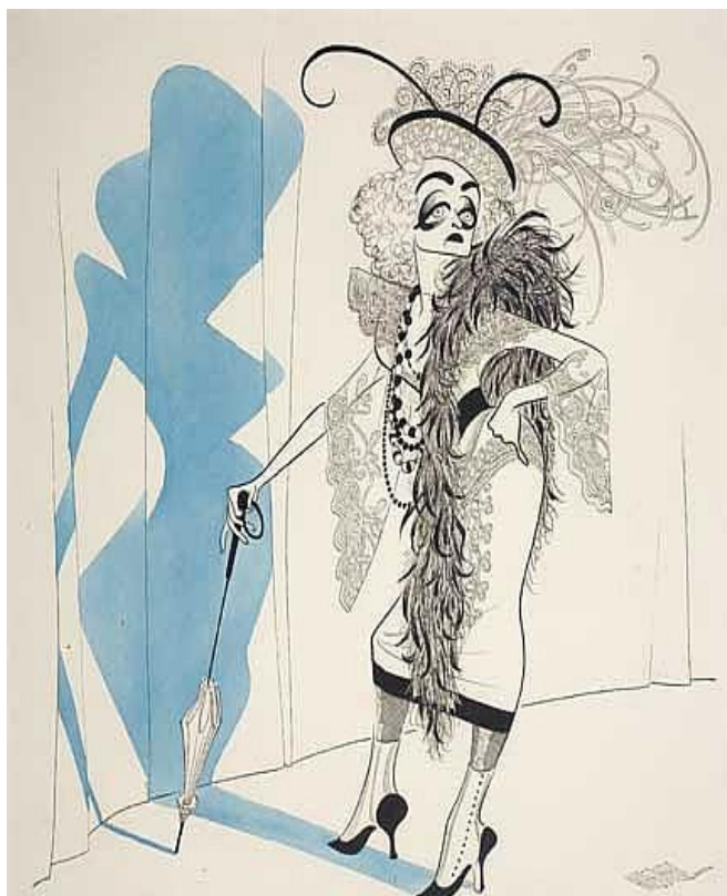
Fig. 4: Bette Davis nei panni di Sadie nella vignetta di Al Hirschfeld dopo il successo di Two's Company